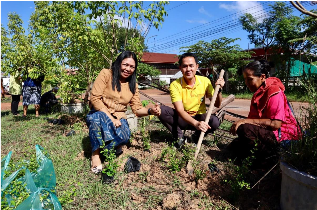
/กิจกรรม Big Cleaning Day...